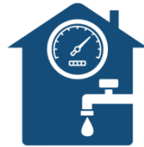
Lecture du compteur d'eau

(Services aux citoyens – Taxe d'eau – Envoyer votre lecture)