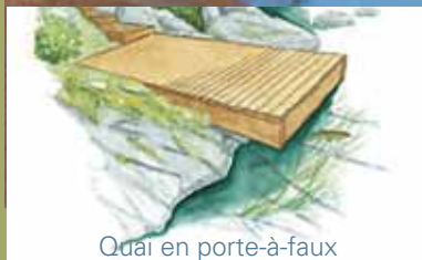
Quai en porte-à-faux