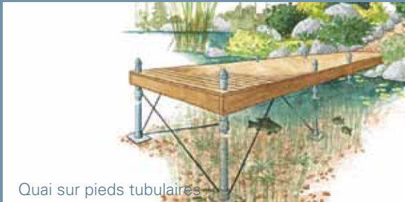
Quai sur pieds tubulaires