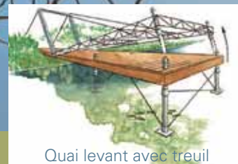
Quai levant avec treuil